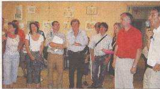
La distribution a bien d'abord été aidée pour le jury de ce premier concours. Il devrait se dérouler tous les deux ans, en alternance avec la journée des peintres.

36 candidats ont participé dimanche 29 juin dernier à la première journée des peintres organisée par l'Office de tourisme.