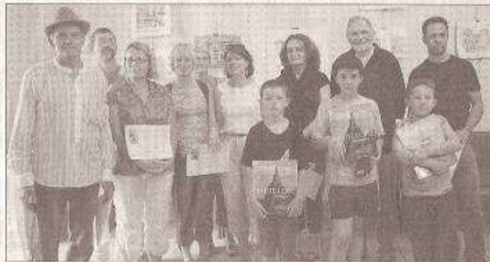
Artistes soucieux, professionnels parfois, ils ont été invités à donner vie et couleurs à la ville derrière leurs chevalets. Avant la remise des prix qui a récompensé neuf artistes.