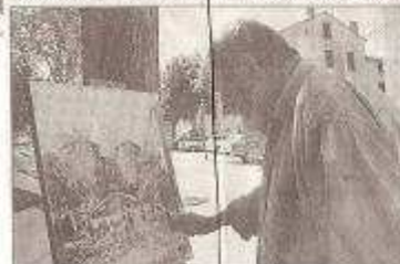
Hier, l'artiste ponot avait ses 7 ans. Pour sa vie, son talent reste l'unique raison qui lui a valu le premier prix professionnel / Paul Marie

À l'âge de cinq ans le Père Noël lui a apporté une boîte d'aguettes de cinquante couleurs. Secante-Doux ne plus tard, Auguste peint toujours.